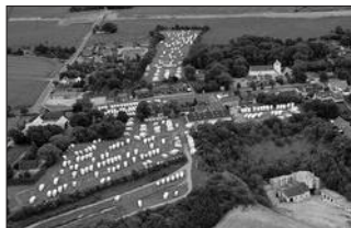
Campinggaarden fylder godt i Ormslev