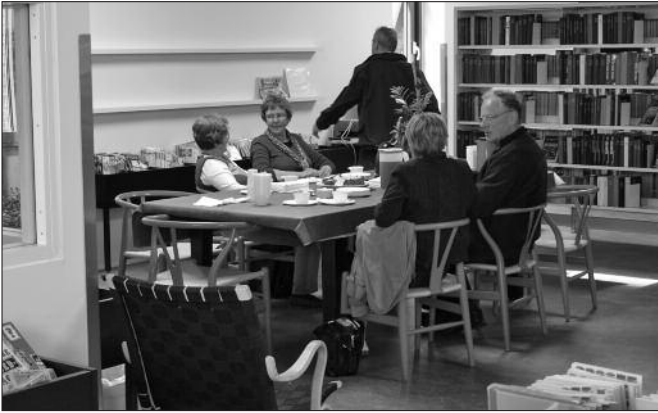
Billedet viser et blik ind i et af møderummene

eller en mælkebøtte, et æbletræ – eller en tidsel. Hver mulighed har sin berettigelse. Samtidig kan man sige, at den, der lærer og læser, også den voksne er i en verden, en konstant bliven til og folden sig ud via de muligheder, som netop f.eks. biblioteket repræsenterer. Hele verden er på biblioteket. Man bliver aldrig færdig med at blive til – og at lære om verden, sig selv og ens medmennesker. – Et bibliotek er i sig selv en mulighed for fremspiren – både for børn og voksne, unge og gamle”