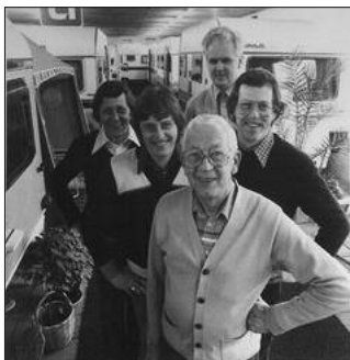
To generationer af Svejstrup familien og trofaste medarbejdere

Campinggaarden er en arbejdsplads for lokalområdet. Gennem årene har mange lo-