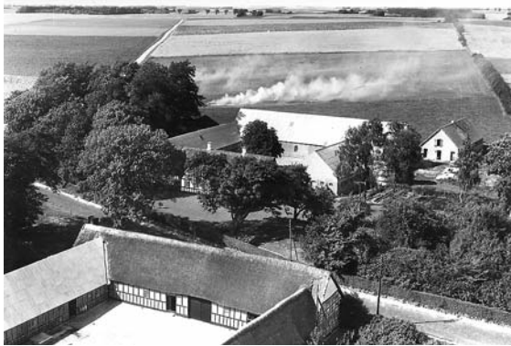
Luftfoto af Stauslet

(fortsat fra nr. 40, september 2007. Man kan stadig få det på biblioteket)