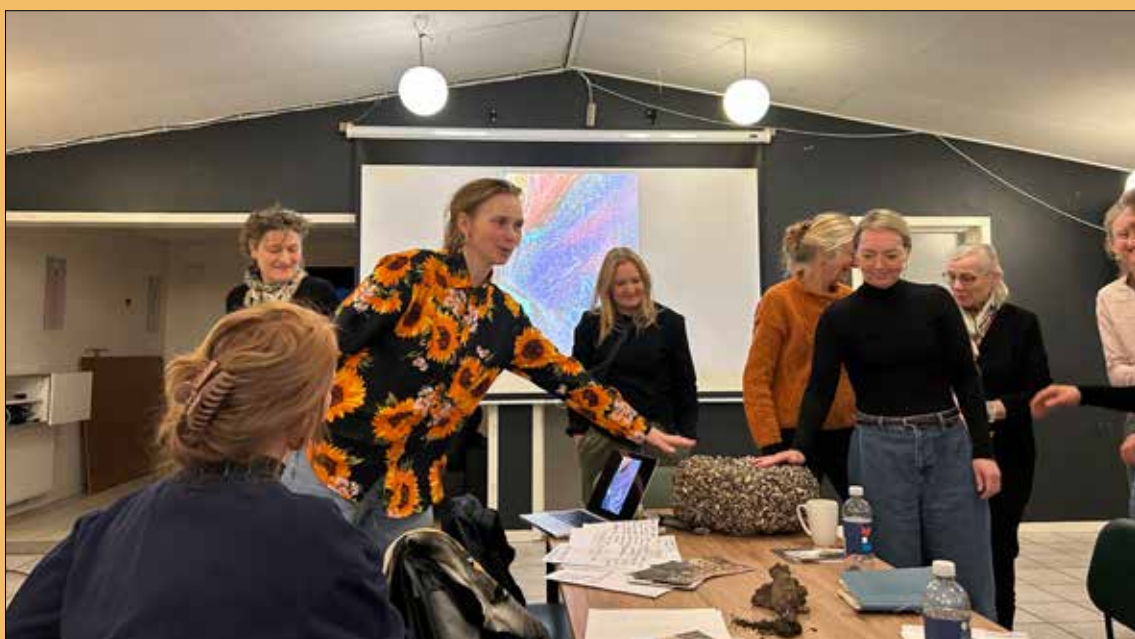
Fra første møde om kunstsperimentariet i Harlev. Læs mere side 5

Nyt fra Harlev Framlev Grundejerforening