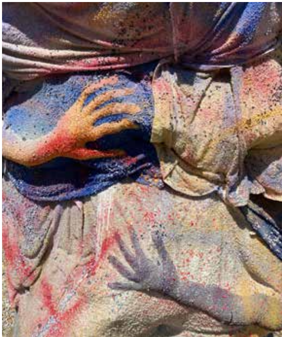
Detalje af Homebode, udstillet på HEART, Socle du Monde Art Festival 2024.

Materialer som sand, grus og jord er omdrejningspunktet i Engelsborg Karlsons skulpturelle værker. Hun har en undersøgende tilgang til sine materialer og udvindingen af dem, og tager udgangspunkt i emner og problematikker som krop, politik, økologi, feminisme og materialitet. Engelsborg Karlson