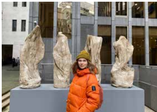
Selvportræt ved værket "Reaktivitet", som var udstillet på "Sculpture in the City 10th edition", London 2021 & 2022

Engelsborg Karlsons værker er blevet vist på bl.a. Den Frie Udstillingsbygning, Kunsthal Aarhus, Kunsthal Charlottenborg, Museet for Samtidskunst,