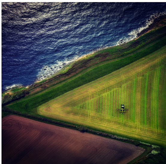
Foredrag om naturkriser

Bibliotekets program for vinter og forår 2024 er godt i gang. De kommende måneder er naturen på programmet, når biblioteket indbyder til foredrag, film og litteraturvandring.