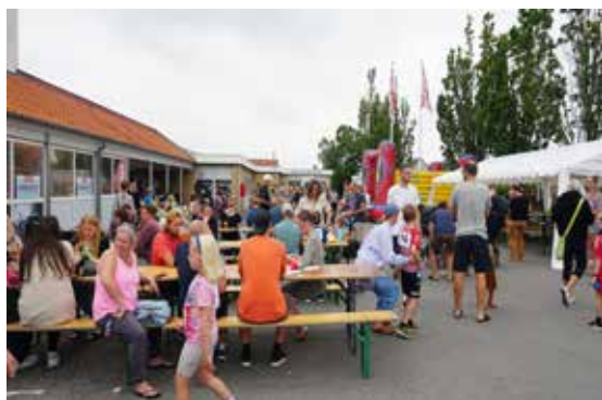
Lokaldysten Harlev