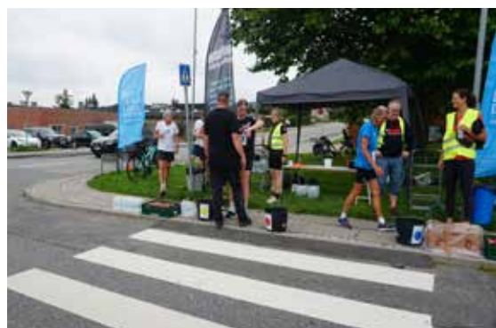
Lokaldysten Harlev