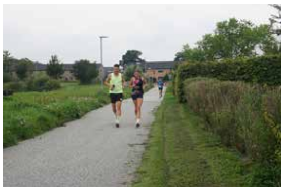
Lokaldysten Harlev

I alt blev der løbet imponerende 224 km. Hvor meget, der blev tilbagelagt på cykel og i gang forbliver hemmeligholdt frem til afgørelsen i september. De kørte kilometer til dette års store børne sponsor cykelløb talte også med i det endelige resultat i Lokaldysten.