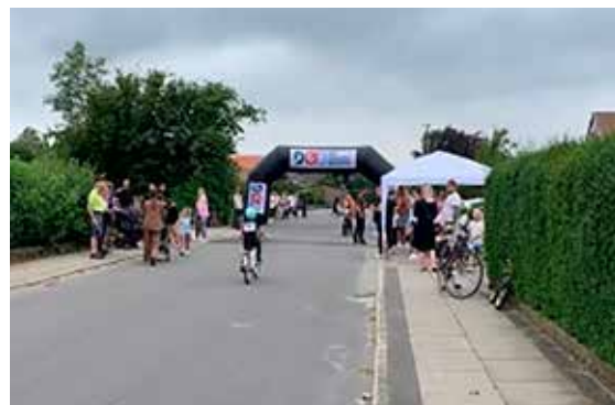
Lokaldysten Harlev

Om Harlev er at finde øverst på sejrsskamlen, når Aarhus' mest aktive lokalsamfund skal kåres, er i skrivende stund endnu uvist. Resultatet offentliggøres den 11. september 2023.