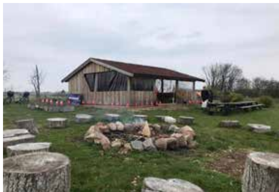
Fælleshytten i Gl. Harlev