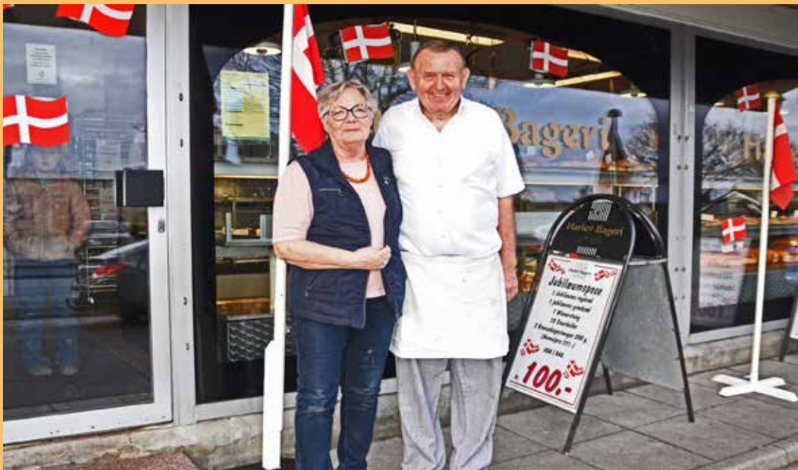
Harlev Bageri: 100-års jubilæum

Nyt fra Harlev Framlev Grundejerforening