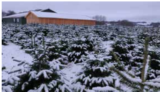
Hørslev Julemarked

Hørslev er en lille landsby lige nord for Harlev. Du kender måske Hørslev, fordi du interesserer dig for heste og kommer på Kirstinelund Ridecenter. Det kan også være, at du er mere til Padel-tennis og lægger vejen forbi We-padel af den grund. Endelig kan det jo også være, at du omkring juletid kommer forbi Hørslev Julemarked for at julehygge og købe et juletræ eller en æbleskive (Hørslev Julemarked har åbent fra sidste weekend i november).