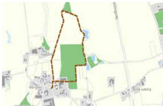
Kort over Hørslevstien

Du er velkommen i Hørslev og på Hørslevstien.