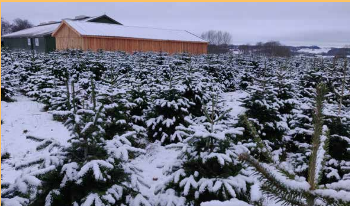
Hørslev Julemarked