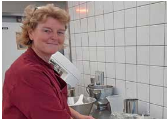
Dorthe Virring, caféleder.

kehuset. Blandt andet kan man læse caféens menuplan. Find bladet på Folkehusets hjemmeside under Aktiviteter eller på Harlev App'en – se under Brugerrådet Folkehuset.