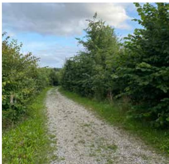
2022: Åbo Skov bliver officielt indviet i 2014, blad nr. 68. Starten af projektet er omtalt nr. 59 fra i 2012. Billedet her er fra 2022, hvor skoven for alvor er vokset op.