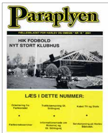
Paraplyen nr. 18 år. 2001

Det er sjovt at se de tidligere numre af Paraplyen igen og (gen-) opdage begivenheder som f.eks. at HIK fik ny klubhus i 2001 (nr. 18)