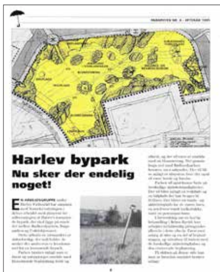
Paraplyen nr. 4 år. 1995

Når man bladrer igennem de tidligere numre af Paraplyen, tegner der sig et tydeligt billede af et aktivt, festligt og utroligt engageret lokalsamfund – både områdets mindre landsbyer og Harlev, som har været præget af vokseværk i hele Paraplyens levetid. I de første år fylder etableringen af motorvejen nord for Harlev f.eks. meget – i det første nummer kan man bl.a. læse, at fællesrådets trafikudvalg har fået reel indflydelse på linjeføringen af motorvejen – og det samme gør planlægningen af byens hjerte, Byparken, hvor de første skitseforslag kan ses i Paraplyen nr. 4.