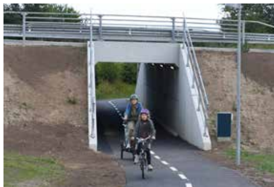
Camilla og hendes to børn prøvekører cykelstien mellem Harlev og Gl. Harlev.

Med det og på vegne af forretningsudvalget vil jeg ønske jer alle en god dag og et godt efterår:-)