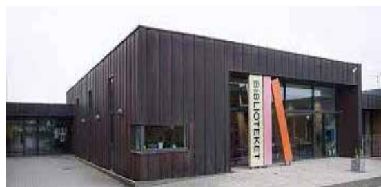
2020: Harlev Bibliotek kan fejre 10-års fødselsdag for kombi-biblioteket. I blad nr. 93 kan man læse jubilæumstalerne som er en beretning om et centralt og samlende men også til tider vindblæst hus. I blad nr. 49 fra 2009 kan man se fundamentet til Harlev Bibliotek blive støbt, og i blad nr 52 bringes det første foto indefra det nye bibliotek, som åbnede den 31. maj 2010.