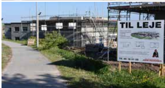
2012: På dette tidspunkt er der stadig drivhuse på Ketting Parkvej. De bliver bl.a. bliver omtalt i nr. 61 fra samme år.