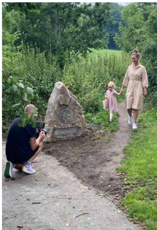
Optagelser til filmen om Harlev

I samarbejde med AD Medie og Nagel film arbejdes der i Kommunikationsudvalget med at lave et kort filmspot om Harlev. Vi forventer, at have ”premiere” senere på året. Tusind tak til alle borgere og virksomheder, der har støttet op om projektet.