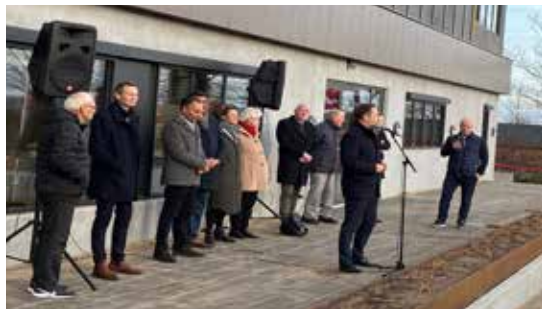
2021: Endelig bliver Harlev Idræts- og Kulturcenter indviet efter en kæmpe stor indsats og massiv opbakning fra borgere og virksomheder i vores lokalområde. Projektet er omtalt mange gange i Paraplyens spalter, og i nr. 98 kan det endelig erklæres for åbent.