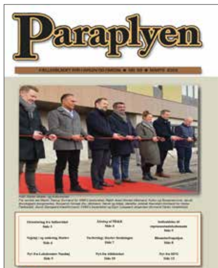
Paraplyen nr. 98 år. 2021

og at HI&K så åbnede det nye idræts- og kulturcenter ret præcist 20 år senere i 2021 (nr. 98),