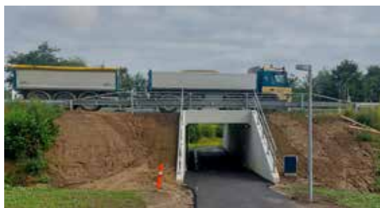
2022: Endelig er der kommet hul under Stillingvej, så bløde trafikanter kan færdes sikkert mellem Harlev og Gl. Harlev. Så ikke nok med at skolevejen dermed blevet mere sikker for flokken af Gl. Harlev-børn, så kan alle nu nemt benytte sig af de skønne grønne områder omkring landsbyen, omtalt i nr. 99.