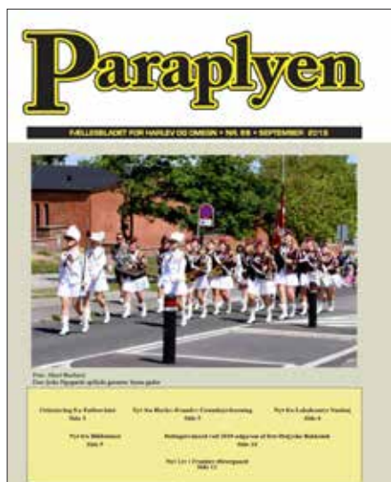
Paraplyen nr. 88 år. 2019

og at Årslev Engso blev etableret og åbnet i 2003 (nr. 22).