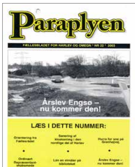
Paraplyen nr. 22 år. 2003

og at HI&K så åbnede det nye idræts- og kulturcenter ret præcist 20 år senere i 2021 (nr. 98),