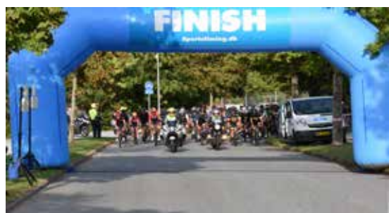
2018: Det Østjyske Bakkeløb på vej over målstregen. Løbet blev omtalt første gang i Paraplyen nr. 52, sept. 2010, hvor artiklen indledes med: "HIK afviklede onsdag 11. august sit første rigtige motionscykelløb, DET ØSTJYSKE BAKKELØB.