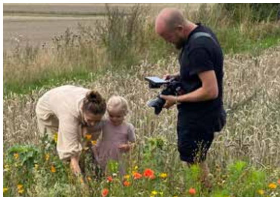
Optagelser til filmen om Harlev