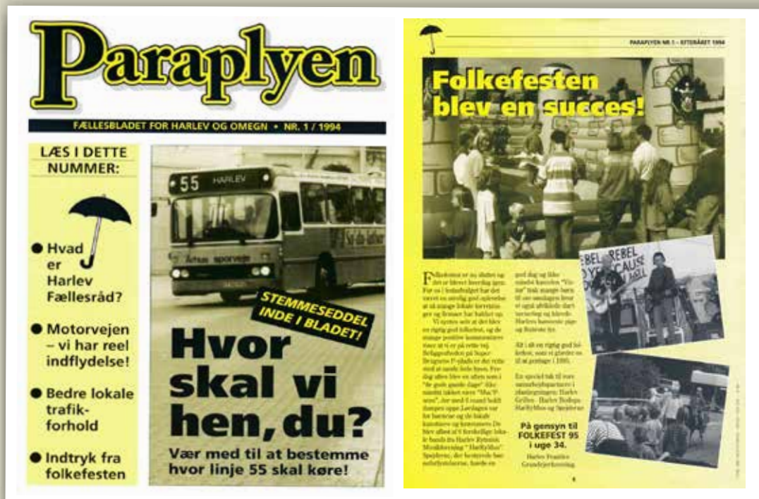
Foto: Forside og bagside af Paraplyen nr. 1 fra 1994

FÆLLESBLADET FOR HARLEV OG OMEGN • NR. 100 • SEPTEMBER 2022