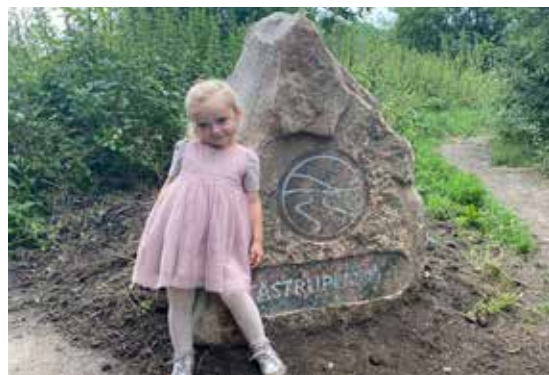
En af de flotte sten, der markerer Tåstruplandet. Her ved Rødlundvænget på stien mellem DII Kompasset og Harlev Bofælleskab ud til Lillering Mark.

I arbejdet i fællesrådet er vi generelt meget optaget af og glade for den skønne natur, vi er omgivet af. En natur vi finder unik, hvilket vi ikke er ene om.