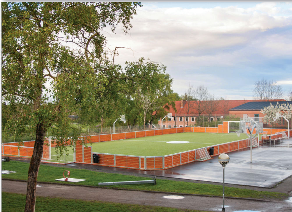
Multibane med tilbehør under anlæggelse

FÆLLESBLADET FOR HARLEV OG OMEGN · NR. 67 · JUNI 2014