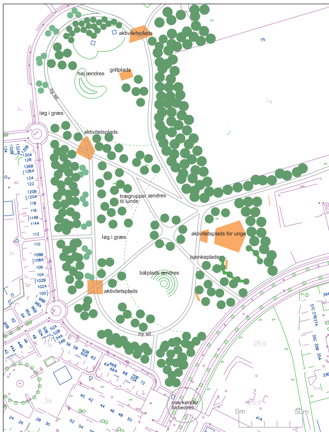
Her kunne en hundelufferplads eventuelt placeres

fremgår det, hvor jeg foreslår hundepark i firkanten: trægruppe ændres til lund, løg i græs. Området er ikke stort, men også kun ment som mødested og ikke motionsområde for hund og ejer.