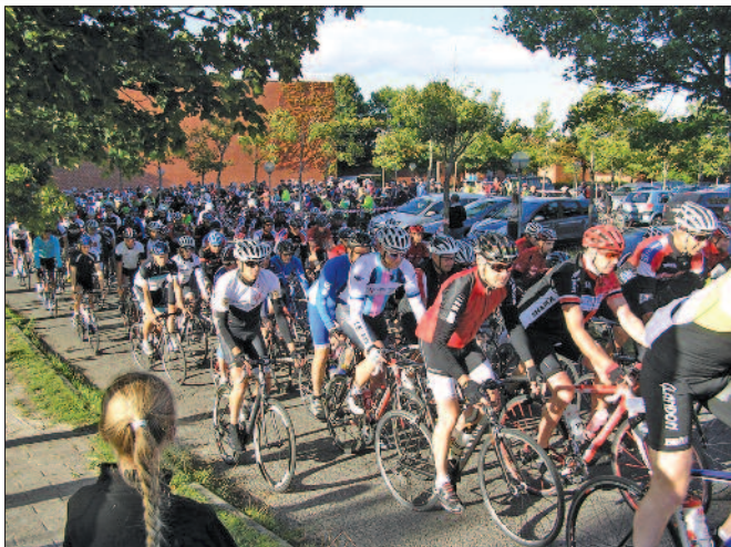
Starten går for distancen på 60 km

Der var rigtig mange, der havde valgt den lange rute på 60 km. Langt de fleste. Men noget af det vi var mest glade for var, at børnene var vendt tilbage i forhold til sidste år: I alt 70 børn deltog i løbet. Og det, synes vi, er rigtig godt. Ikke mindst børn har jo godt af at holde sig i gang med motion. Og forhåbentlig har de fået lyst til at cykle lidt mere i hverdagen, evt. sammen med deres for-