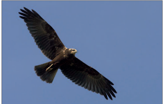
Ung rørhøg over Tåstrup Sø.

På P-pladsen er der opsat en informationstavle, som kort fortæller om Tåstrup Sø. Der er etableret en sti til fugletårnet. Stien starter som en grussti, der fortsætter som board walk på en 100 meter lang træbro, som leder en gennem et stykke spændende natur. I dette sumpområde kan man gå tørskoet og se de planter, fugle og dyr, som knytter sig til denne ellers ufremkommelige naturtype. Her i sensommeren blomstrer langs gangbroen kattehale med rødviolette blom-