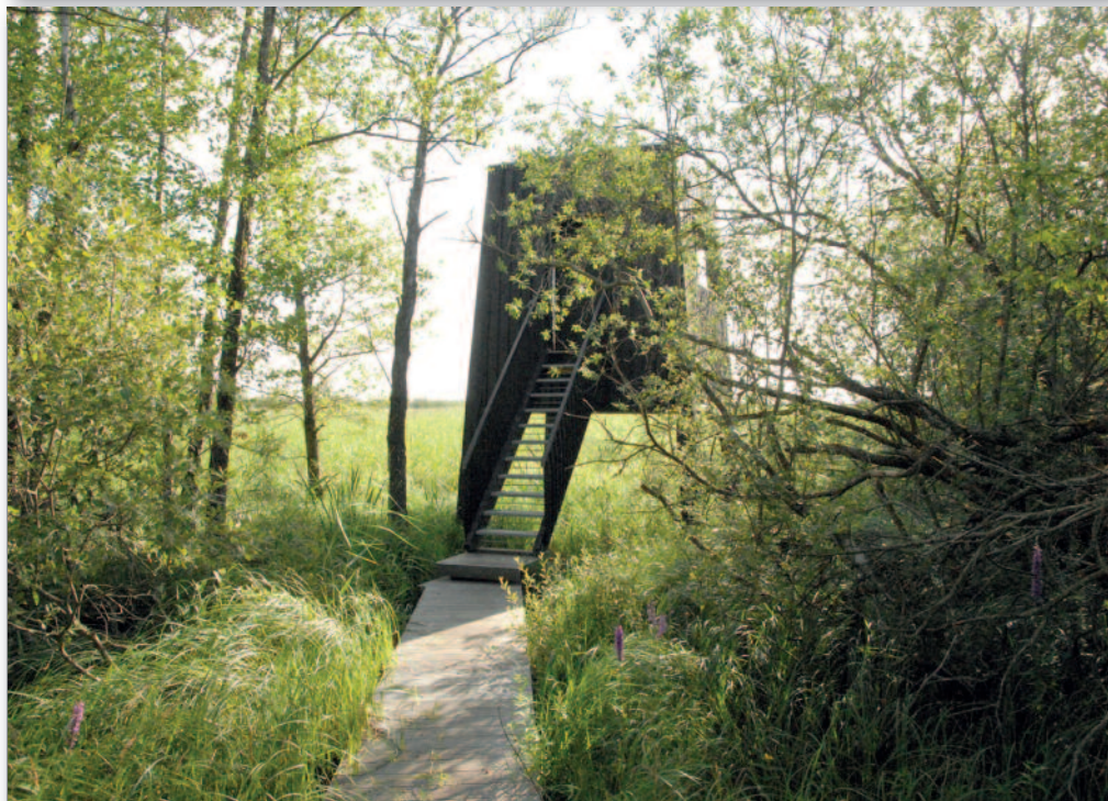
Fugletårnet i vestenden af Tåstrup Sø med udsigt over det store rørskovs område.

FÆLLESBLADET FOR HARLEV OG OMEGN · NR. 64 · SEPTEMBER 2013