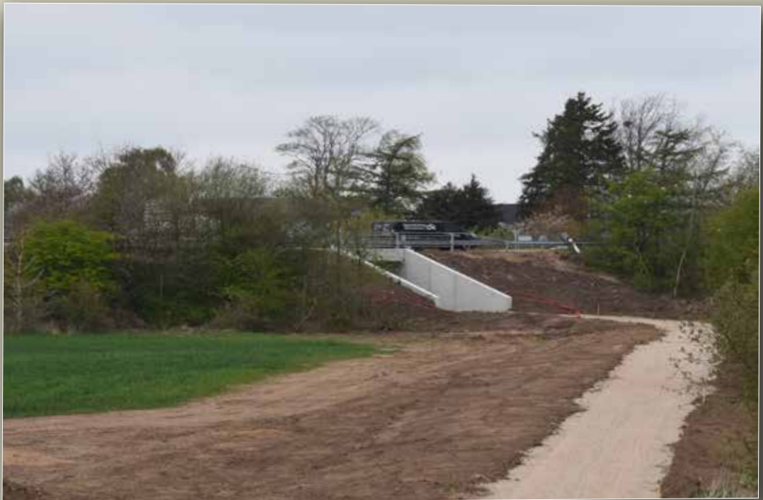
Ny cykelsti under Stillingvej.

FÆLLESBLADET FOR HARLEV OG OMEGN ● NR. 99 ● JUNI 2022