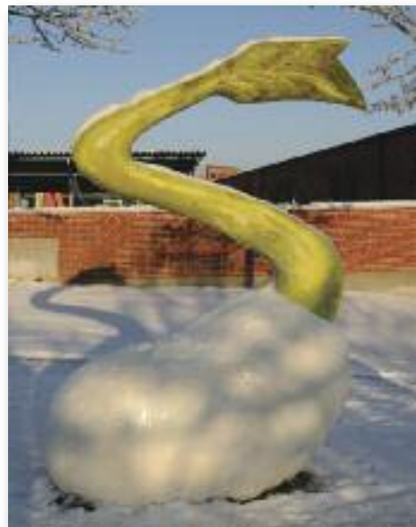
Vintermotiv af Spiren ved indgangen til Biblioteket.