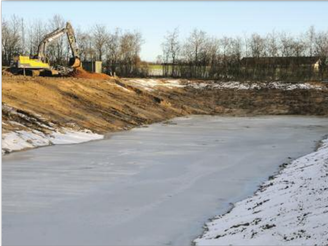
Arbejdet med tostrengt kloaksystem er i fuld gang, her på marken øst for Harlev.

FÆLLESBLADET FOR HARLEV OG OMEGN · NR. 70 · MARTS 2015