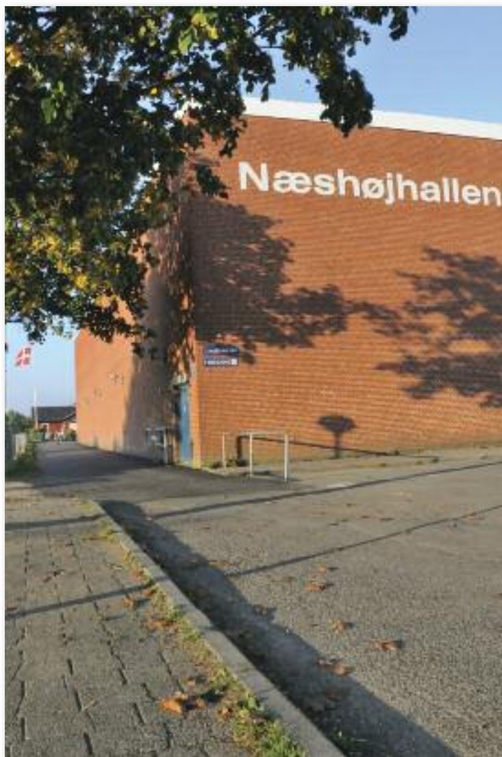
Adgangsvejen til idrætsfaciliteterne og fodboldklubhuset har fået ny belægning.

På mødet den 19. november blev vi enige om at arbejde videre