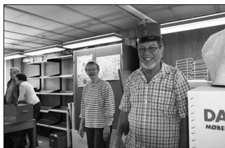
Lokalarkivet flyttes med godt humør

nytte Biblioteket. De gamle åbningstider fra Harlev Bibliotek vil fortsætte på den måde, at man her kan forvente fuld service som tidligere. Vi kalder det åbningstid med personale.