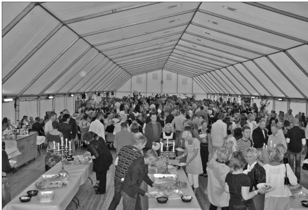
De gamle elever mødte talstærkt frem til festen

Der var boder med forskellige aktiviteter og tombola. For