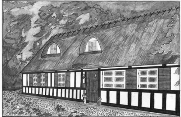
HUSMANDSSTEDET I GAMMEL MOSE

Motivet på årets julemærke er husmandssted fra Gammel Mose