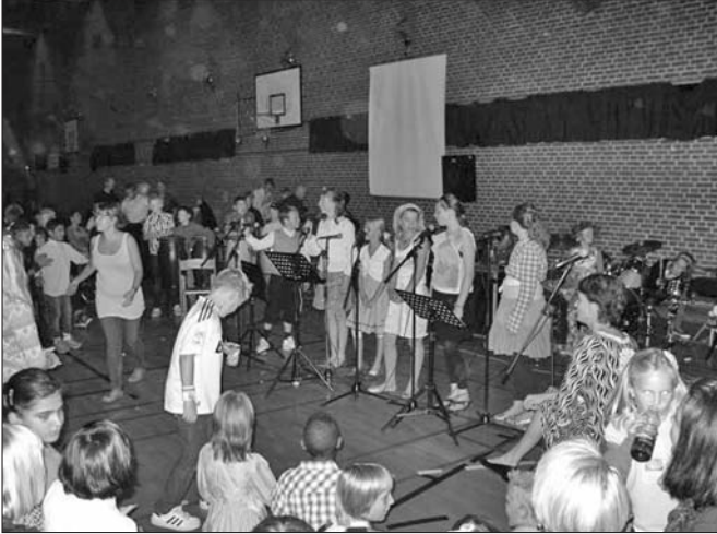
Alle nuværende elever deltog i ugens festligheder og her ses underholdning fra torsdag aften

de ældste elever var der diskotek i gymnastiksalen. Elever, lærere og pædagoger havde forberedt festen. For-