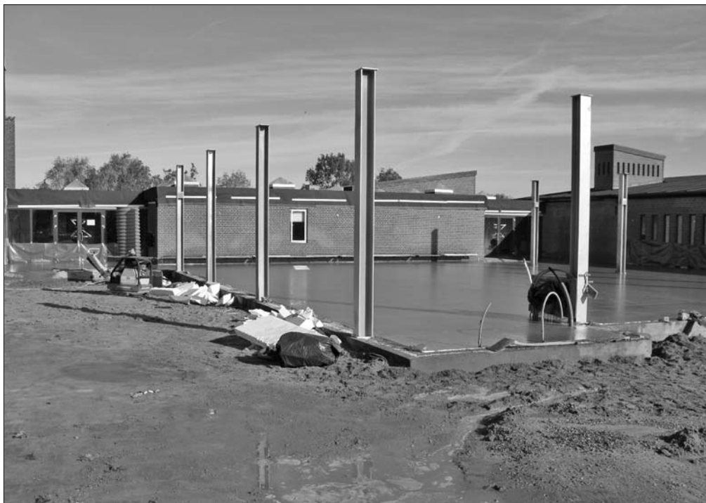
Fundamentet støbes til et kombibibliotek