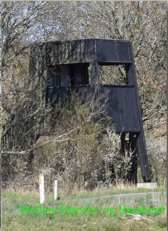
Mellem Hørslev og Hørskind