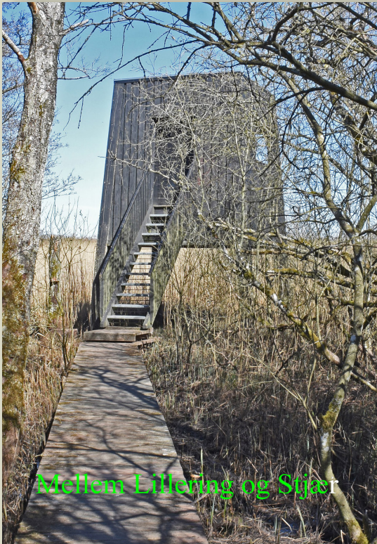
Mellem Lilleving og Stjær

FÆLLESBLADET FOR HARLEV OG OMEGN ♦ NR. 91 ♦ JUNI 2020