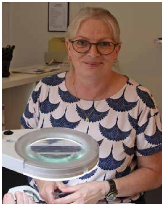
Tekst og foto: Aksel Buchard

Hun kommer fast på Næshøjcentret og desuden i tre lokale bofællesskaber.