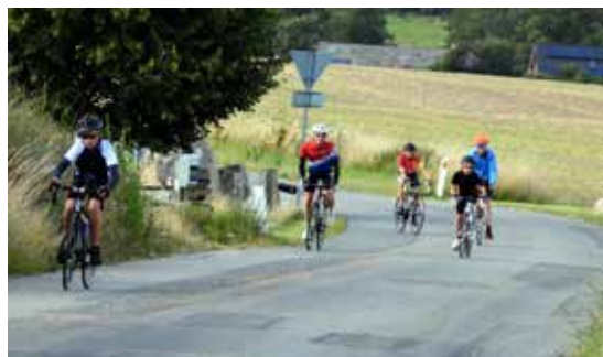
Taget på toppen af Åbo-bakken

Vi har gennem de seneste år fokuseret vores arbejde med at øge sikkerheden og skabe en professionel afvikling af løbet – det er en nødvendighed, når vi kan tiltrække så stærkt et felt bestående af mange dygtige motionister, klub-ryttere og en betydelig gruppe licens-ryttere.