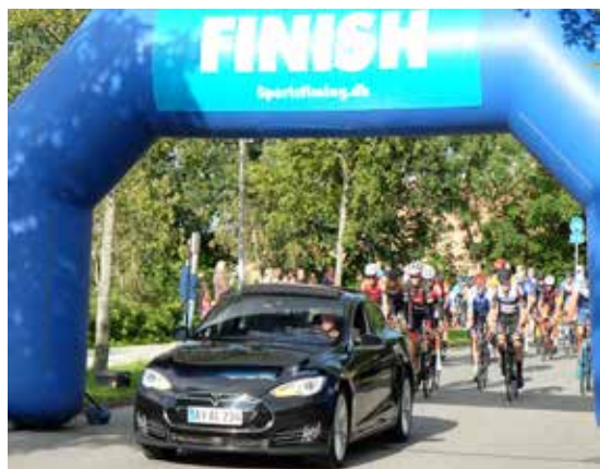
Fra starten af 63 km løbet

Onsdag den 14. august kl. 18.00 lød startskuddet til den 11. udgave af den østjyske cykel-klassiker, Det Østjyske Bakkeløb (DØB), som med start og mål i Harlev har udviklet sig til et af de mest søgte og traditionsrige cykelløb i det østjyske område.