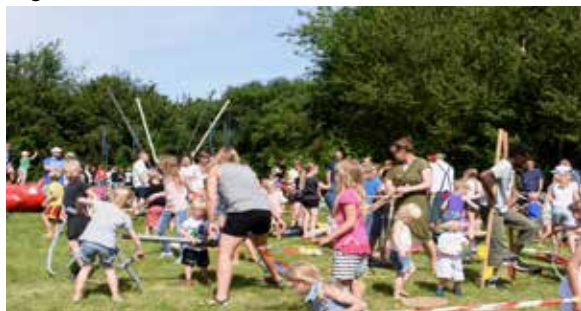
Der var mange aktiviteter for børn

Vi havde regnet med 300-400 personer til spisningen, men vi druknede i vores egen succes, der blev solgt ca. 600 billetter, og der kom vel mellem 700-800 mennesker over dagen.