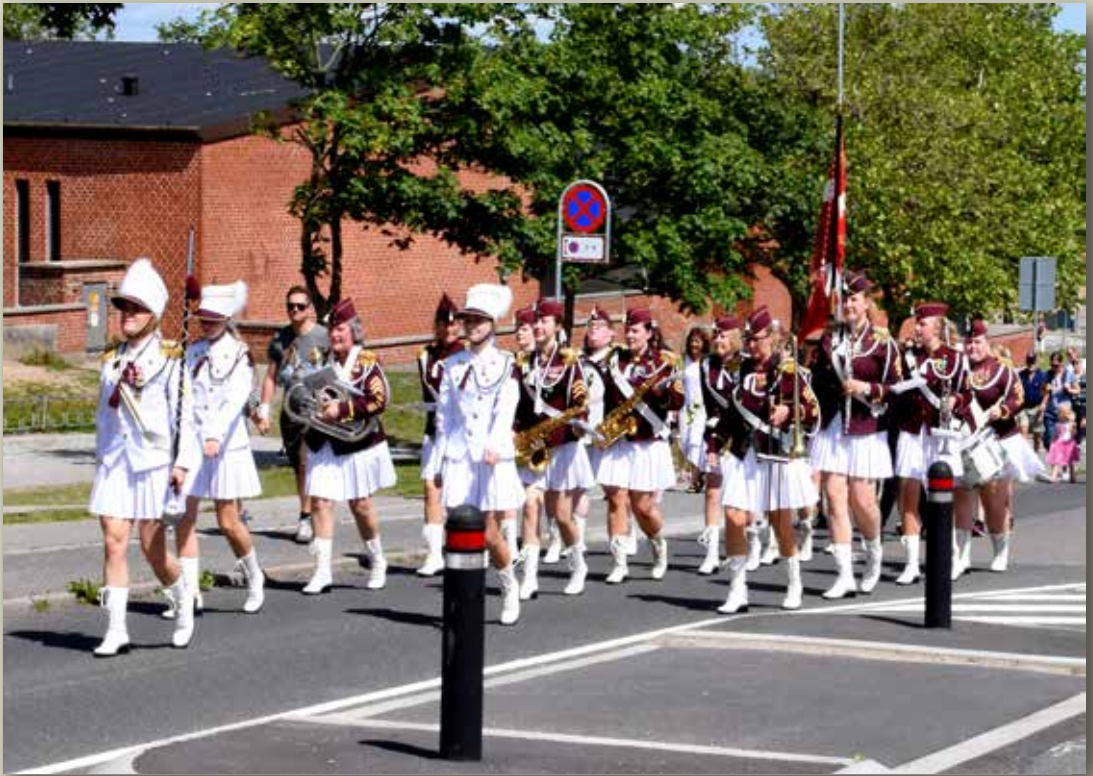
Den Jyske Pige гарде spillede gennem byens gader

FÆLLESBLADET FOR HARLEV OG OMEGN ♦ NR. 88 ♦ SEPTEMBER 2019