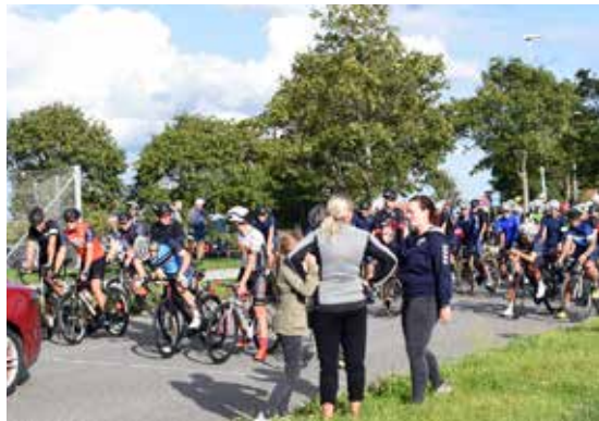
Taget på Næshøj-bakken

Men den største og mest afgørende faktor bag succesfuld og sikker afvikling af et godt løb er den store indsats som ca. 75 frivillige lægger i at hjælpe til. Både på pladsen og i start/målområdet ved Næshøj og ude på ruterne gør de en kæmpe forskel. Det smitter af på deltagerne, hvilket igen smitter af på medhjælperne. Så med dette, og suppleret med de mange trofaste sponsorer bag DØB, kan man kan i den grad sige, at Harlev løfter i flok.