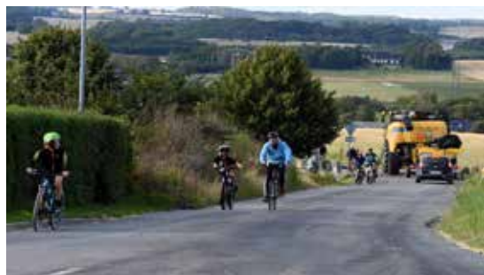
Taget på toppen af Åbo-bakken

Vi har oplevet en stor søgning gennem de seneste år og har haft omkring 500 deltagere i både 2016, 2017 og 10 års jubilæumsløbet i 2018. Men i år brød vi alle rekorder og sluttede online forhåndstilmeldingen med rekordmange 509. De blev suppleret med 89 tilmeldte på dagen, så i alt deltog 598 i Det Østjyske Bakkeløb.