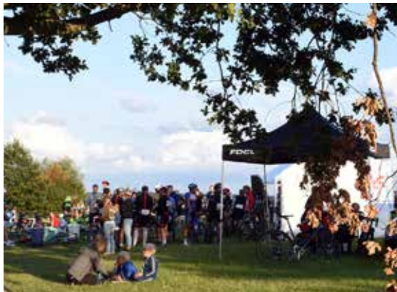
Taget på Næshøj-bakken