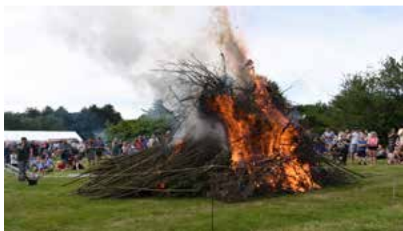
Bålet var flot

Jubilæet gik over al forventning, folk var glade og tilfredse. Klovnens underholdt børnene på bedste vis - og køen til ansigtsmaling var lang. Hoppeborg og hoppepude vakte stor glæde, og spejderne havde travlt med heksefremstilling til bålet.