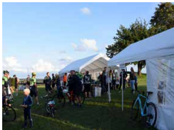
Taget på Næshøj-bakken

Igen i år går overskuddet fra DØB til realiseringen af Harlev Idræts- og Kulturcenter. Vi forventer et overskud, der ligger over de tidligere år, så et forsigtigt bud lyder på 65-70.000 kr, som lægges oven i det beløb, der i 2018 blev overrakt projektet. Tilbage i efteråret blev det akkumulerede beløb fra DØB på 248.064 kr. suppleret med en lokal DØB' belt op kampagne, som gav 189.456 kr., så der i alt blev overdraget 437.520 kr. til Harlev Idræts- og Kulturcenter.