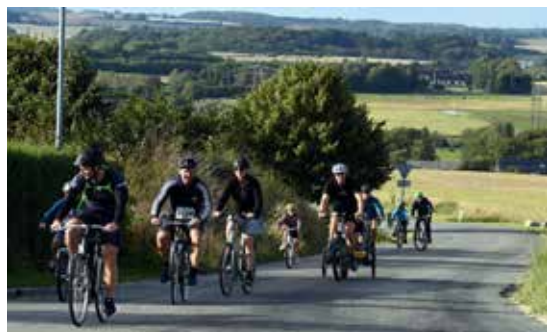
Taget på toppen af Åbo-bakken

Hovedparten på den lange rute på 63 km, en god flok havde fornøjelsen af 35 km, og endelig var ca. 150 – primært lokale familier og børn – ude og prøve kræfter med ruten på 14 km, der blandt andet byder på en bakket tur mod Åbo og Ormslev, men også suppleret med et depot halvvejs, hvor sukkerdepoterne kan fyldes op – til særligt stor glæde for feltets yngste deltagere.