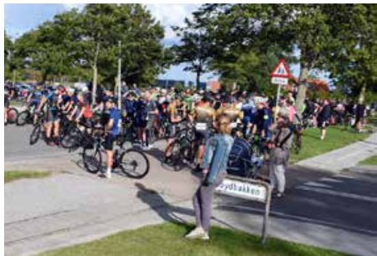
Taget på Næshøj-bakken

Således havde vi også i år hjælp fra både politihjemmeværnet, som hjalp med at afvikle løbet på udsatte poster, og i de hurtigste grupper blev feltet støttet af 6 motorcyklister fra BMW Race Marshalls. Alt sammen noget som deltagerne – udover den obligatoriske gratis pølse og øl/vand sponsoreret af Harlev Framlev Grundejerforening – kvitterer meget positivt for.