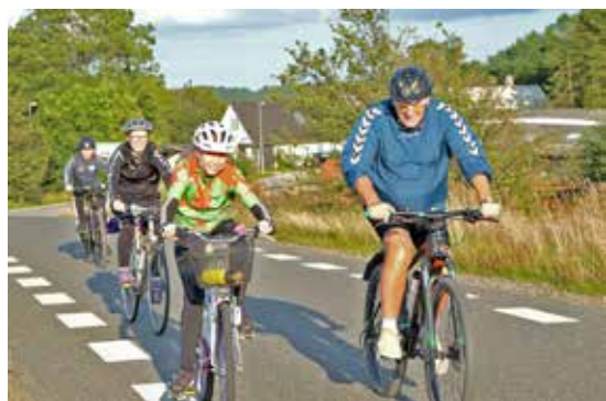
Fra Gl. Harlev mod Stillingvej

Vejrguderne havde planlagt det fint i år, og trods dystre udsigter i ugen op til ændrede vejret sig de sidste par dage, og på dagen blev løbet afviklet i perfekt vejr til en tur rundt på de østjyske landeveje.