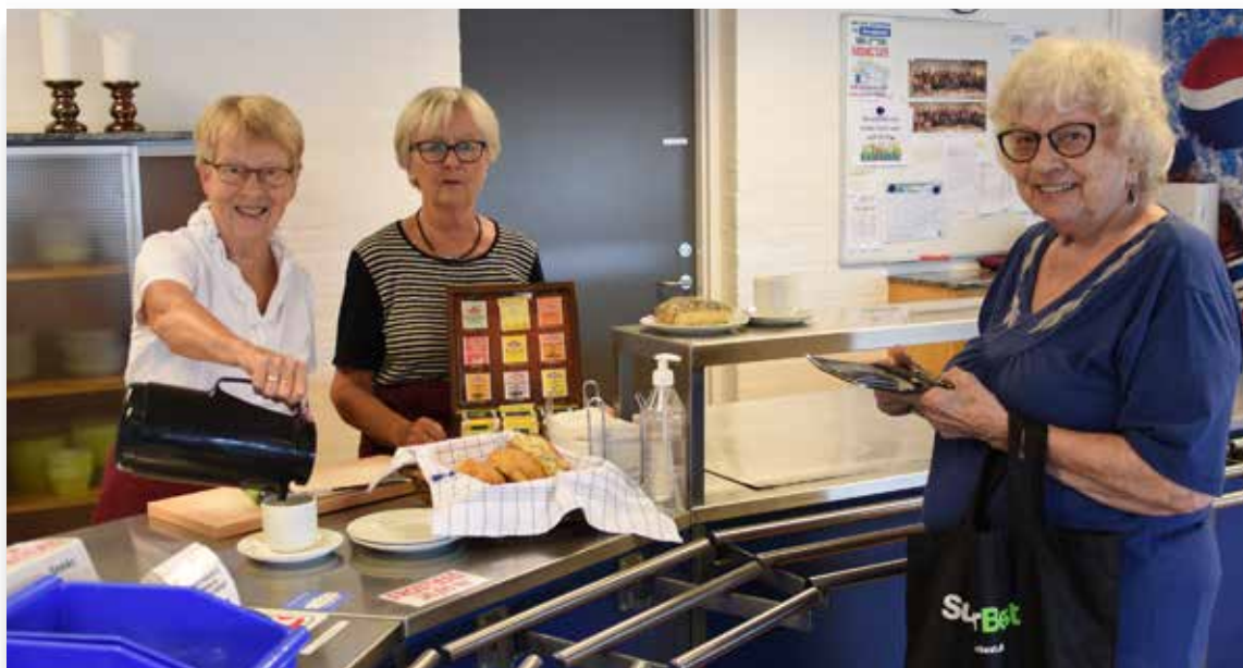
Vil du være vores nye kollega?

Af Inger Graversen, formand for Næshøjrådet, foto: Aksel Buchard