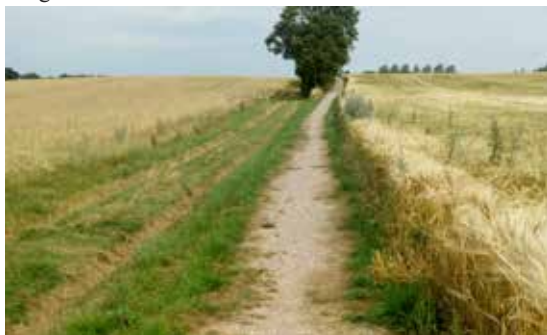
Kirkestien i aktuel stand

Kirkestien mellem Edelhofvej og Gammel Harlev Gennem flere år har Harlev Fællesråd forsøgt at få Aarhus Kommune til at retablerer og bundsikre den gamle markvej mellem Edelhofvej og Gammel Harlev. Det lykkedes langt om længe og i 2018 var stien klar til brug.