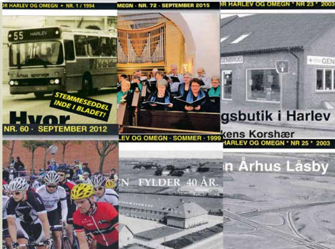
Collage af forskellige forsider

FÆLLESBLADET FOR HARLEV OG OMEGN ♦ NR. 84 ♦ SEPTEMBER 2018