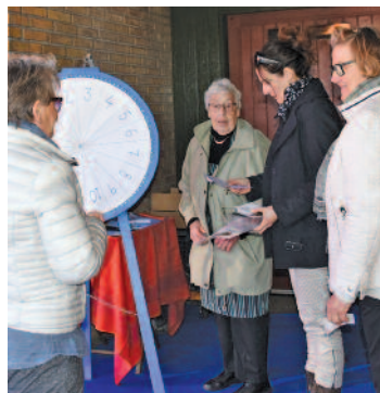
Lykkehjulet var i gang fra kl. seks

rundstykker til 50 øre til en jubilæumstærte til 50 kr.