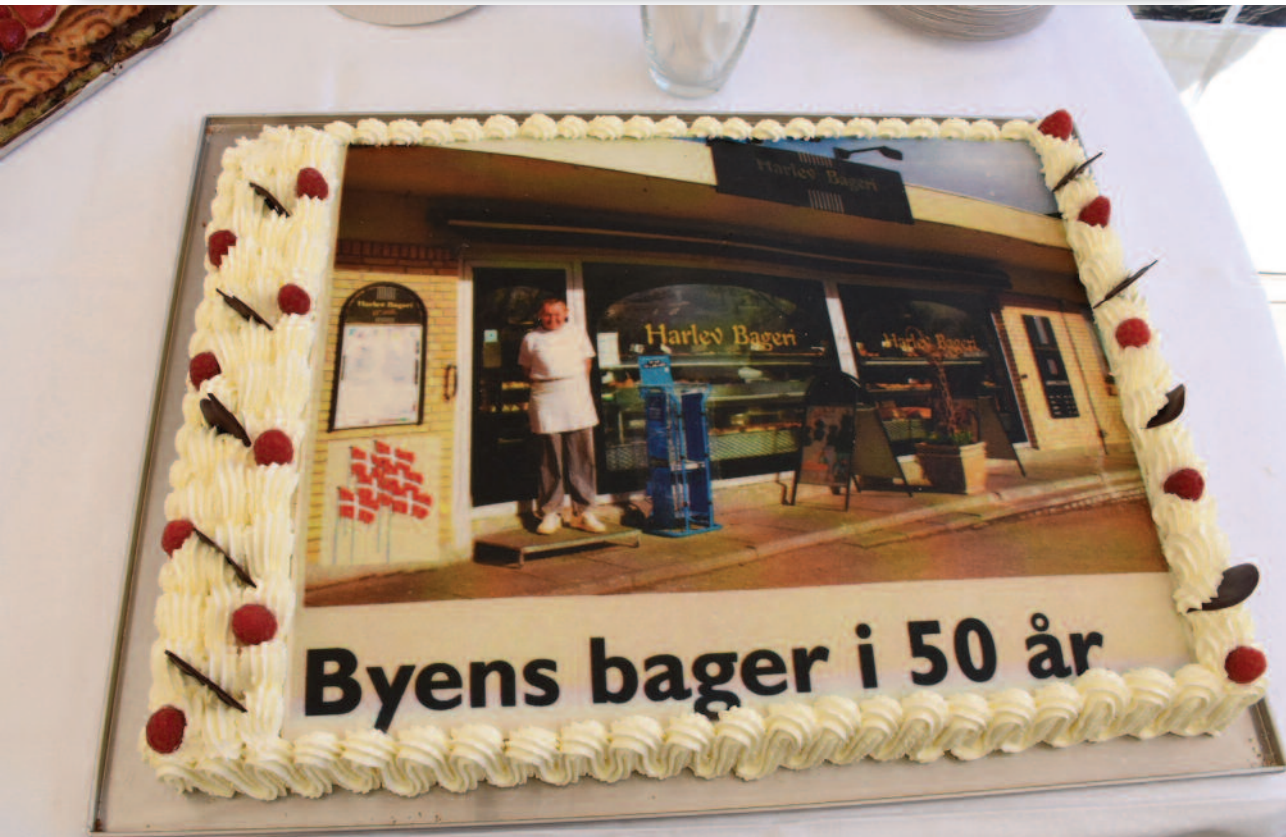
Lagkagen var pyntet med Byens bager

FÆLLESBLADET FOR HARLEV OG OMEGN · NR. 79 · JUNI 2017