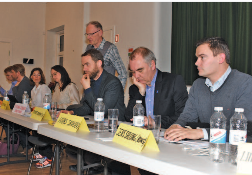
Panelet grubler over svar

Harlevs problem med at få familier med børn hertil. Fare for at Aarhus bliver skævvredet. 150 huse er dog en begyndelse, men relevant at tænke større ting ind. Der er fortsat pæn afstand til landsbyen Tåstrup. Der er næppe nogen fare for at der bliver bygget vindmøller i Hørslevområdet.