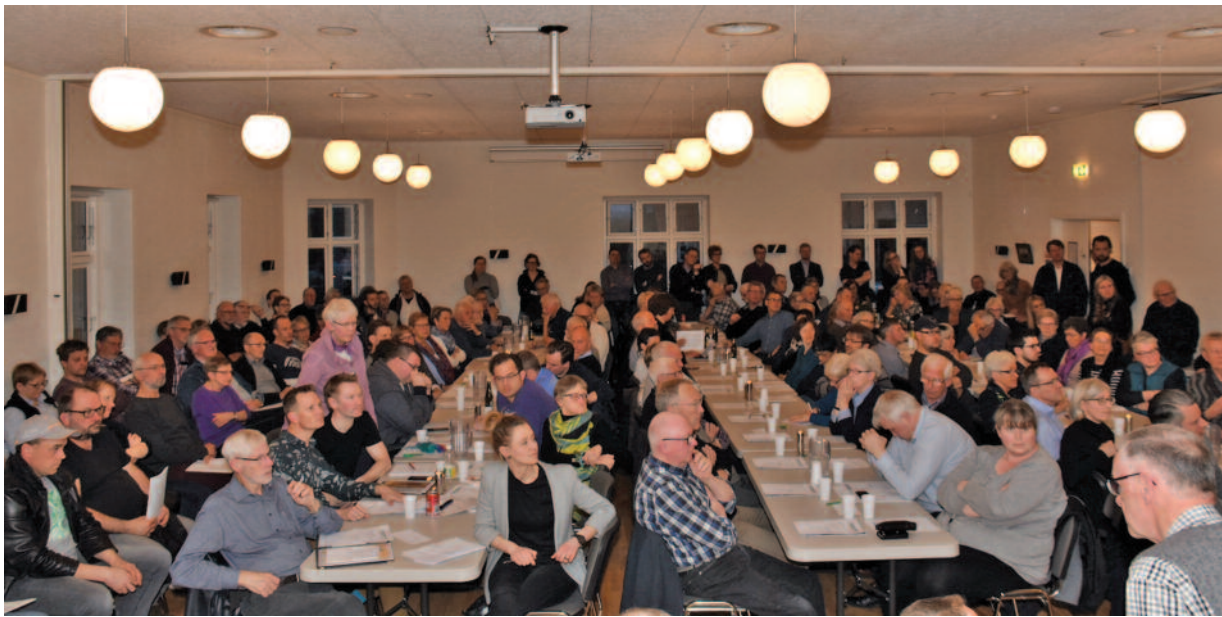
Der lyttes til spørgerne

Får bygget mindre boliger i eksisterende områder, fortætning i centrale Harlev.