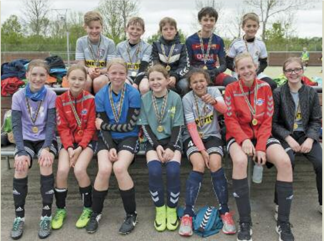
Både piger og drenge fejrede multibanens 3 års fødselsdag den 20. maj

FÆLLESBLADET FOR HARLEV OG OMEGN · NR. 80 · SEPTEMBER 2017