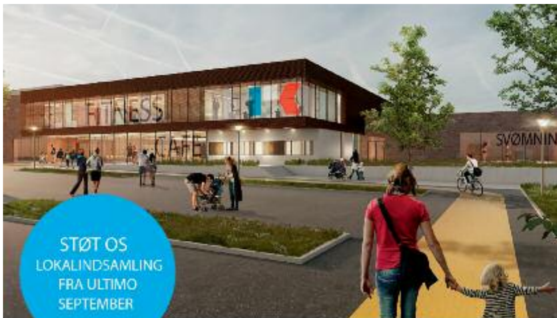
Harlev Idræts- & Kulturcenter, Illustration august 2017