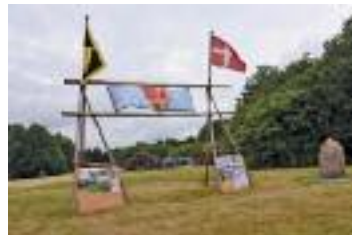
Spejderne havde rejst en flot indgangsportal til Byparken

Vi siger tak til begge for deres flotte Sct. Hans taler.