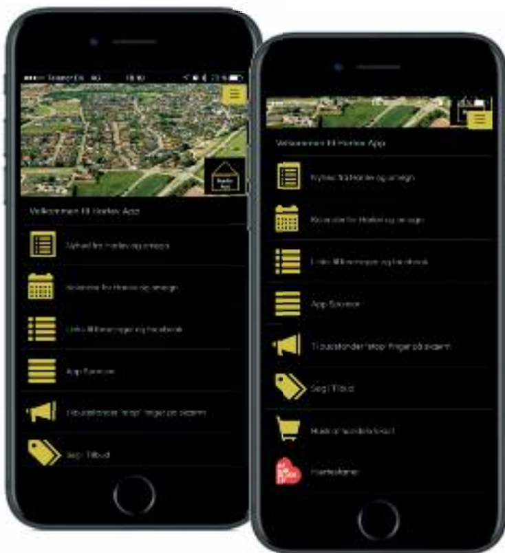
Dette er forsiden på App'en. Fra forsiden har man tilgang til 8 funktioner samt menu. Funktionerne er Nyheder, Kalender, Links, Sponsor, Tilbudsstander, Søg i Tilbud, Handel lokalt og Hjertestarter.

Det gik hurtigt op for udvalget, at en løsning, som fremadrettet skulle være holdbar og appellere til alle årgange, skulle være en løsning, som skulle bruges på al-