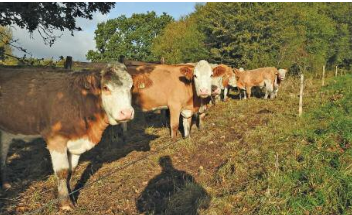
De glade græsningkæer hilser på bag den nye indhegning i Tastrup Mose