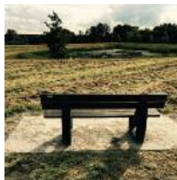
Bænk ved regnvandsbassinet på Ketting Parkvej

Vinteren nærmer sig - måske med sne i vente - men der er desværre enkelte veje, som ikke får ryddet sne - grundet reglen om min. 75% medlemmer på den enkelte vej. Så skynd Jer at melde Jer ind - det kan nås endnu.